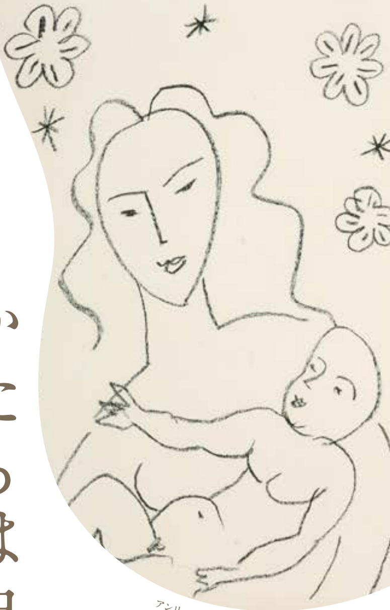
アンリ・マティス《母と子》1951年、総社市蔵